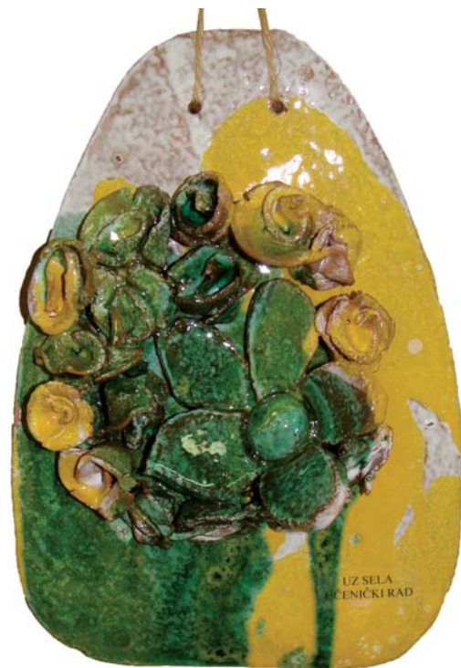
učenička zadruga Osnovna škola Sela PŠ Grada-Razredna nastava