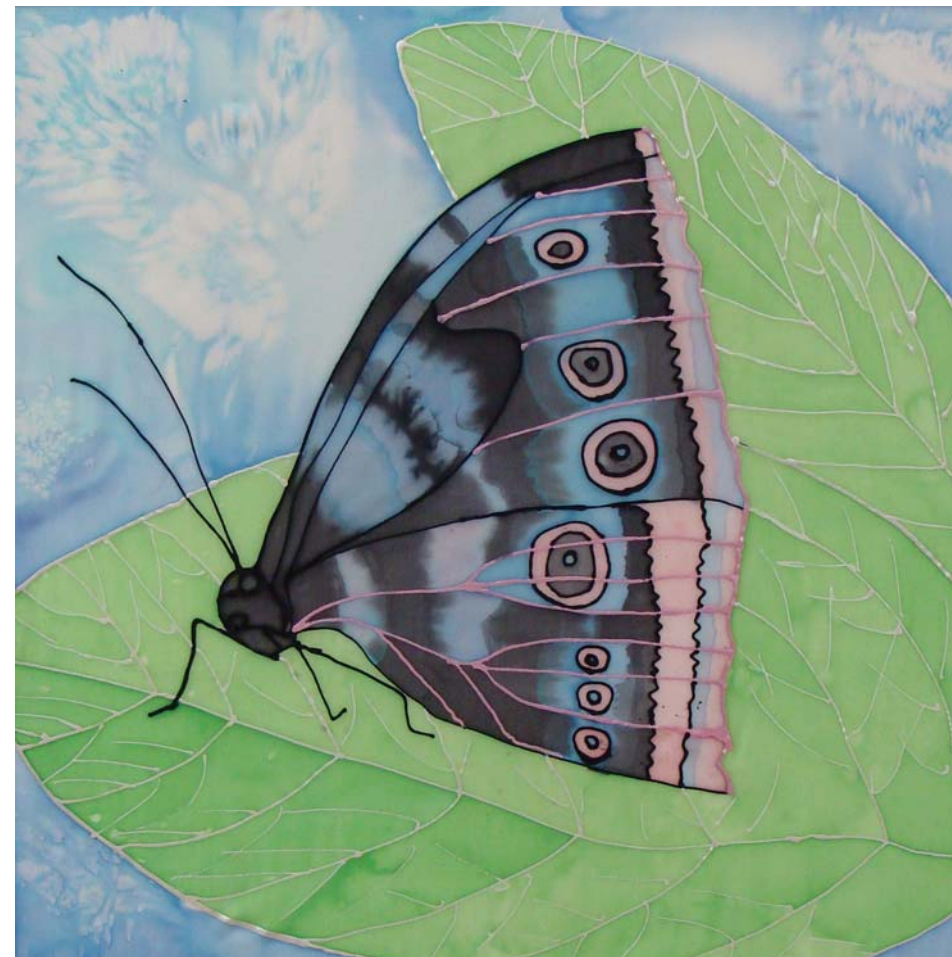
učenička zadruga Srednja škola Petrinja