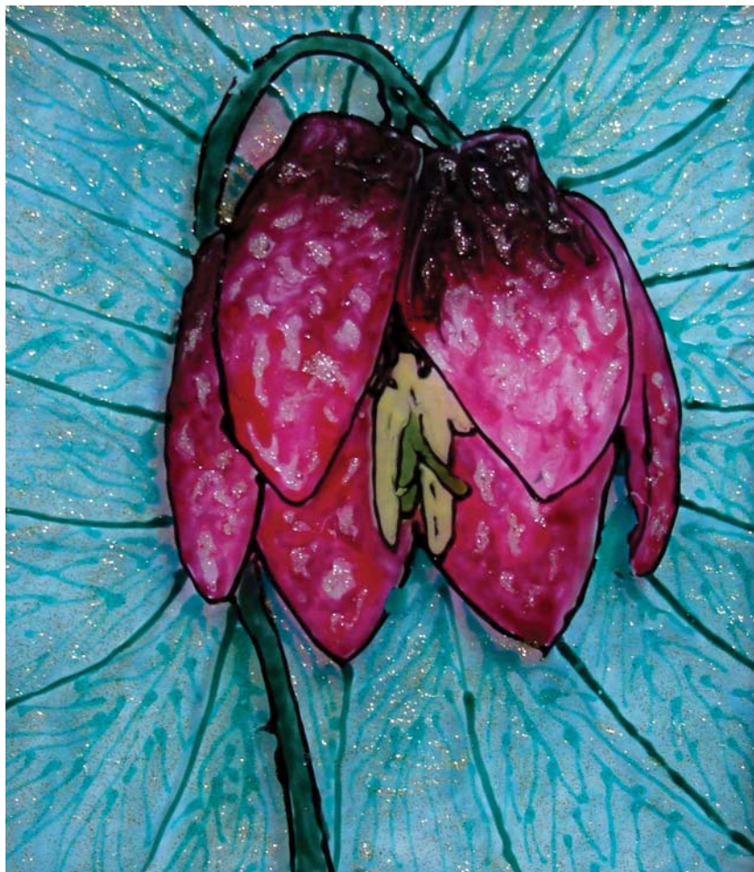
učenička zadruga Srednja škola Petrinja