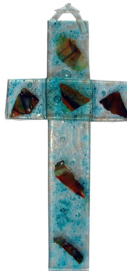
učenička zadruga Osnovna škola Sela PŠ Žažina-Razredna nastava